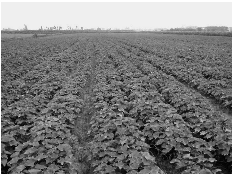
Jatropha-Plantage in Vietnam: Eine Folge des Land Grabbing sind „Grüne Wüsten“

Mit der Erarbeitung von Richtlinien wird durch Regierungen und internationale Organisationen wie der FAO versucht, die Diskussion zu verschieben hin zu den angeblichen Chancen derartiger Investitionen. Richtlinien