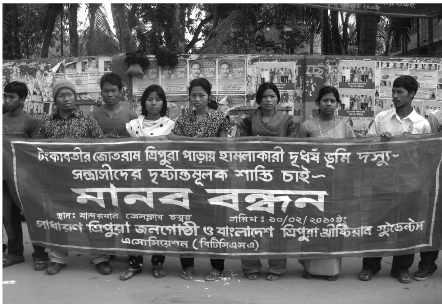
Menschenkette gegen Vertreibung von SiedlerInnen wegen Land Grabbing in Bandarban, Bangladesch